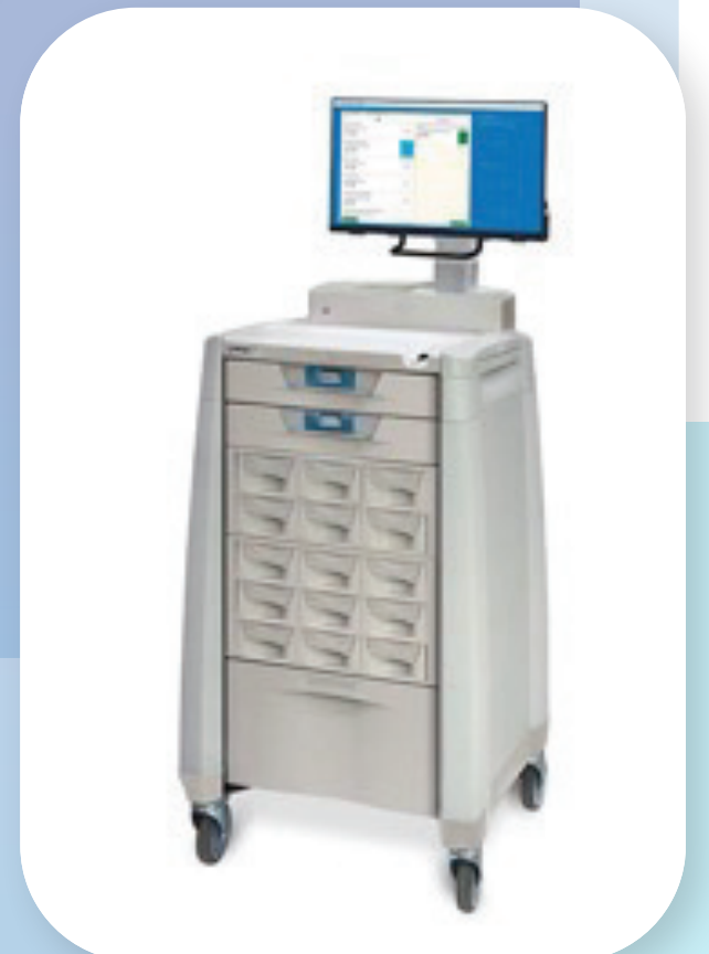
Cabinets à médicaments